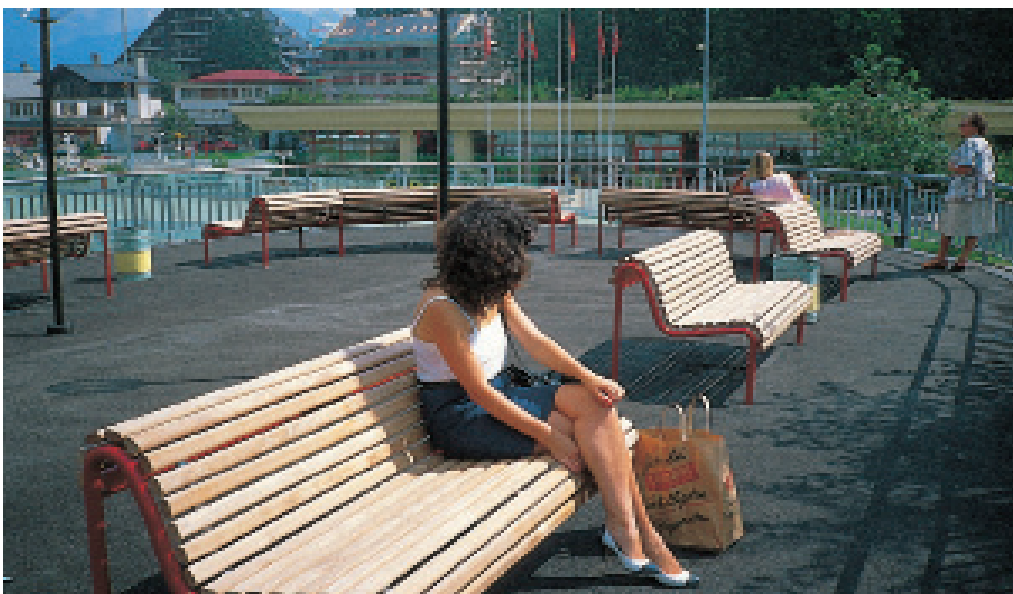
Abb.: Profilbank Modell 100 ; 3-sitzig

Papierkorb Modell 310 , Hockerbank Modell 110 .