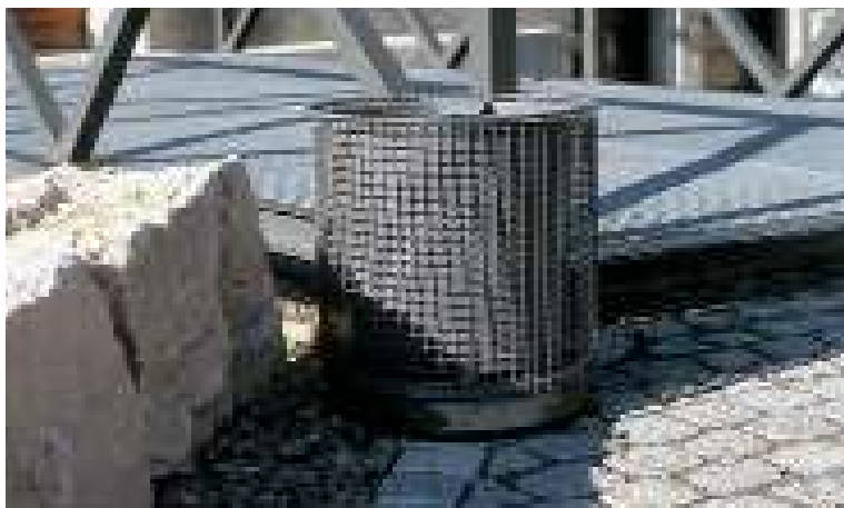
Abb.: Drahtgitter Papierkorb mit vz. Eimer-einsatz; mobil mit Betonplatte

Jung Gitterbänke Modell 202 / 220 / 230 / 240 / 260 sowie JUNG Hockerbänke Modell 211 / 250 .